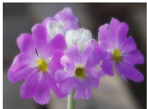
市の花「サクラソウ」