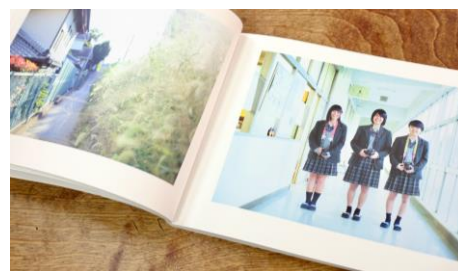
(左)プロジェクトコンセプト「日常こそ、ドラマチック」ポスター (中)映像「ドラマチック四街道(青春篇)」 (右)写真集「ドラマチック四街道」