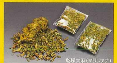
乾燥大麻(マリファナ)

大麻は国際条約で、国際的にも厳格に規制されています。大麻を一部合法化している国でも、大麻の安全性は認めていません。有害な大麻をコントロールするためにやむを得ず認めているというのが実情です。