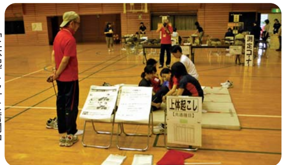
「上体起こし」に奮闘中

今回は昨年よりも参加者が少なく、やや寂しい会となりましたが、年齢に応じて6種目の体力測定と身体組成測定を実施しました。体力を維持・増進していくためには、普段の生活の中で意識して体を動かすことが大切です。ちょっとした運動でも、日々行うことで効果が出てきます。ご自分の体力を知るためにも、是非参加してみてください。