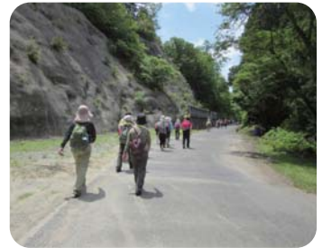
久留里城を目指して