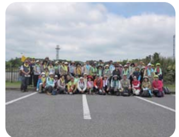
亀山湖畔での集合写真