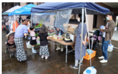
昨年の大きなテーブルの様子