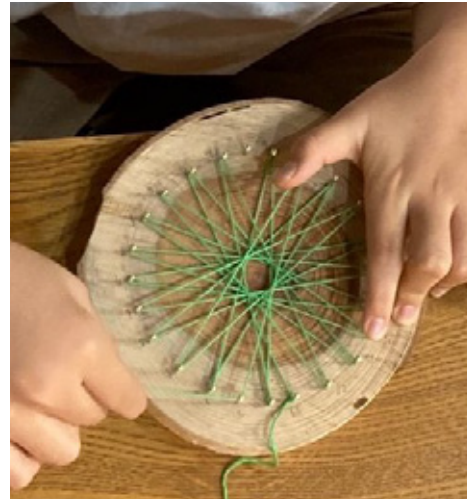
糸かけの体験で美しい「さんすう」の世界へ