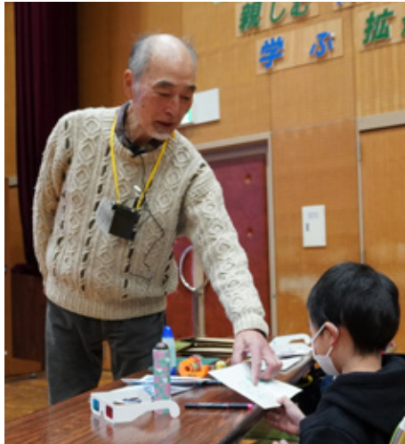
からくり倶楽部主催の親子工作教室