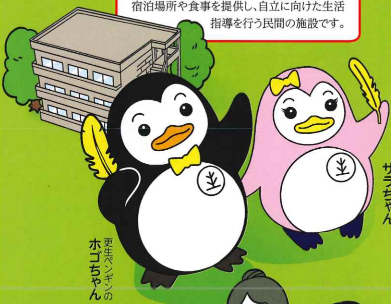
更生ペンギンの ホコちゃん

刑務所等を出た後、帰る場所がない人たちに宿泊場所や食事を提供し、自立に向けた生活指導を行う民間の施設です。