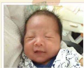
生後22日 ときどき“にこっ”と笑います