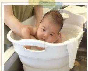
生後1か月 沐浴（お風呂）