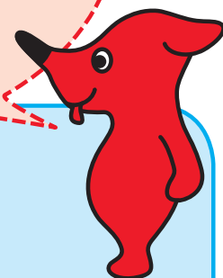
千葉県 マスコットキャラクター チーパくん

ヘルプカードの携帯方法は、障害種別、状況、考え方によって異なります。「財布や定期入れに入れておく」「ケースに入れてカバンの外に取り付ける」等して、持ち歩きましょう