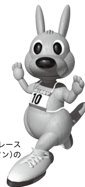
ワラビー 四街道ガス灯ロードレース 大会(ワラビーマラソン)の マスコットです

編集と発行／四街道市教育委員会 〒284-0003 千葉県四街道市鹿渡2001-10 (市役所第二庁舎2階) ☎421-2111 (代)