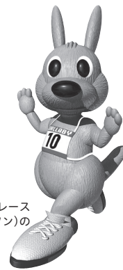
フラビー 四街道ガス灯ロードレース 大会(フラビーマラソン)の マスコットです

編集と発行 / 四街道市教育委員会 〒284-0003 千葉県四街道市鹿渡2001-10 (市役所第二庁舎2階) ☎421-2111 (代)