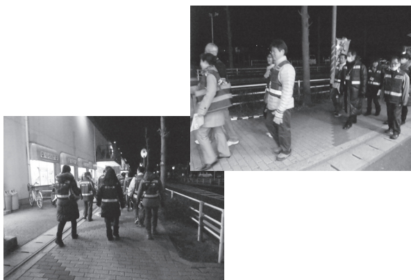
市内をパトロール

市青少年補導委員連絡協議会による合同パトロールが2月19日夕方より、四街道中学校区を会場に行われました。肌寒い季節の、暗くなり始めた中、子どもたちが安全に帰宅できたかを確認しながら、公園や路地を中心にグループ単位で見回りました。