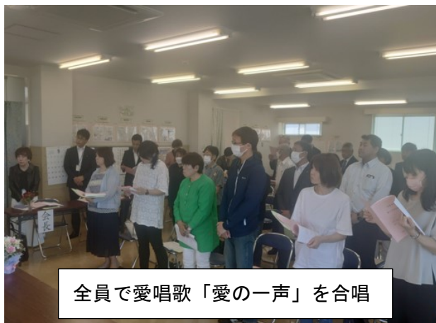
全員で愛唱歌「愛の一声」を合唱

議事では、令和五年度の活動報告や決算報告、令和六年度の活動計画など六つの議案が提出され、議案説明と審議を行った後、賛成多数で全議案が可決されました。