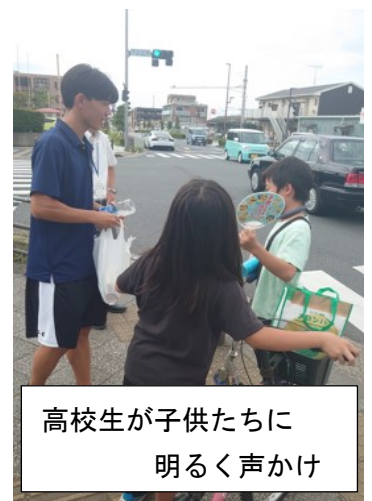
高校生が子供たちに 明るく声かけ

参加者は四つのグループに分 かれて市内をパトロールしなが ら啓発活動を行いました。