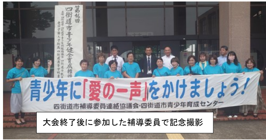
大会終了後に参加した補導委員で記念撮影