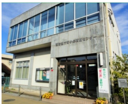
四街道市 青少年育成センター