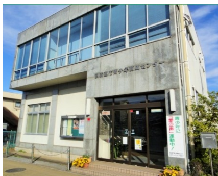
四街道市青少年育成センター

会議等で使用時は利用できません。利用の際はウイルス感染予防の徹底をお願いします。