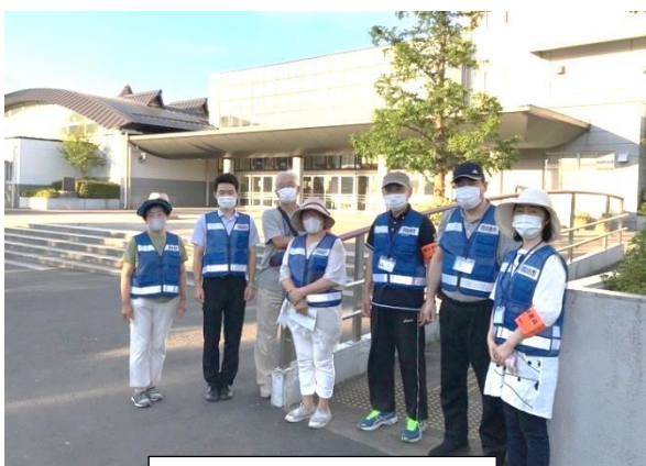
四街道中学校前で