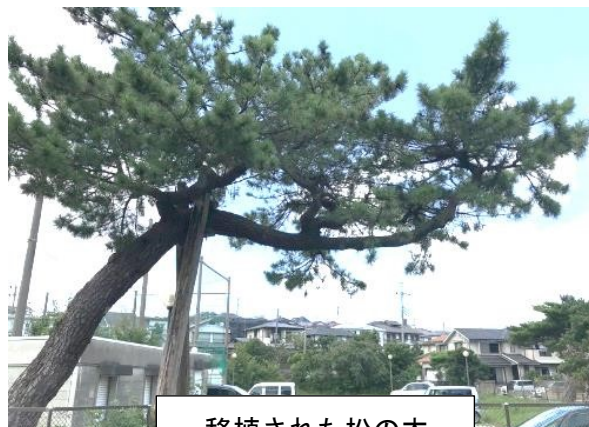
移植された松の木

四街道中学校は、以前は四街道駅北側の大型商業施設の場所に学校があり、その後現在の場所に移転してきましたが、当時の松の木も一緒に移植されており、懐かしい気持ちになりました。