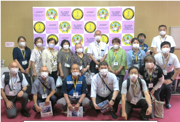
インタビューボード前で記念撮影

令和三年七月十三日、陸上自衛隊高射学校に於いて、四街道市青少年補導委員連絡協議会の第一回研修会が開催されました。高射学校は、千葉市若葉区若松町にある陸上自衛隊下志津駐屯地内にあり、四街道市と隣接していることから私たち四街道市民も盆踊りなどで訪れる方が多いところです。