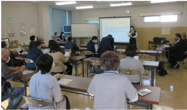
約20名が参加しました

よくし隊レディ「あおぼーし」は平成二十八年に女性が被害者となる性犯罪等を抑止するため、県警の女性警官を中心に結成されました。平成二十九年には、子どもの犯罪防止を強化するため、新たに少年補導専門員を加え、女性と子どもの犯罪防止に取り組んでおり、街頭キャンペーンや学校・企業での犯罪防止講話、護身術の指導を行っています。