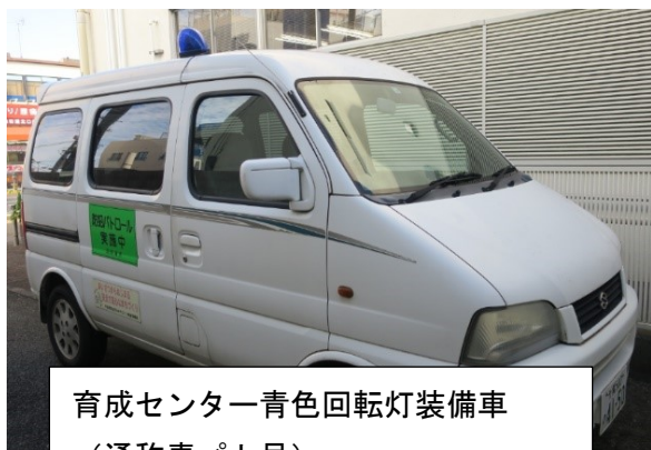
育成センター青色回転灯装備車 (通称青パト号)

青少年補導委員の活動で、昨年度は合計七千二百六十八人に声かけを行い、子どもたちの安心、安全に貢献しています