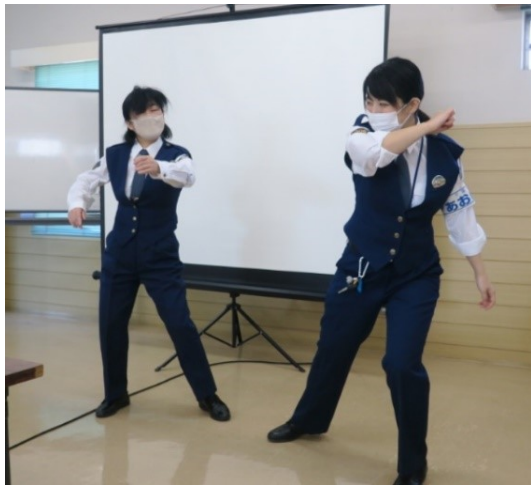
護身術 自分の身は自分で守ろう

子どもが「自分の身は自分で守る」ことができるように私たち大人が、子どもたちへの関わりの中で子ども自身が危険から逃れるための犯罪教育をしていくことが大事だと実感しました。