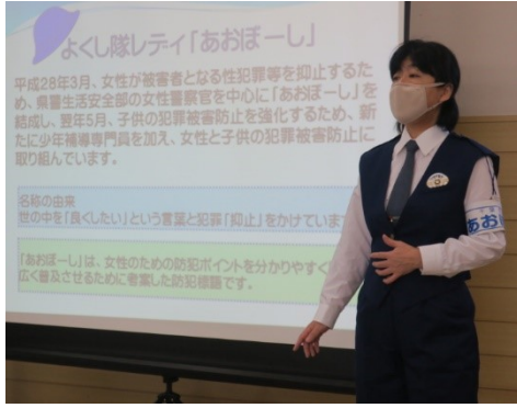
防犯に関する講話

十月二十九日(木)午前十時から、青少年育成センター二階オーブンスペースにおいて、第一回補導委員研修会が開催されました。3密を避けるための参加人数の制限や、換気、消毒などウィルス対策を万全に施しての実施となりました。