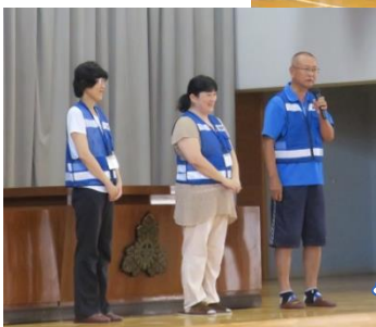
大日小学校の様子