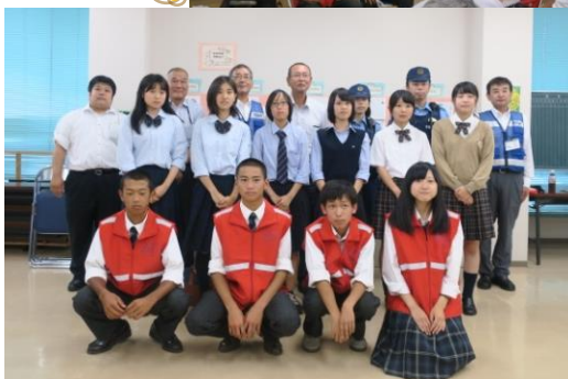
市内高校生のみなさん